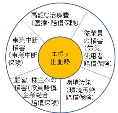
《図表 3》 エボラをめぐるリスク

エボラ出血熱の感染拡大防止に向けた取り組みは、国連や米国、EU等をはじめ現在も世界一丸となって進められている。11月末、国連のエボラ緊急対応ミッション(UNMEER) 13 は、12月を期日に掲げていた感染防止目標達成(患者の70%を治療等)の断念を表明しており、いまだ拡大収束の見込みは楽観できない状況にある 14 。日本政府は、11月28日、西アフリカへの自衛隊機派遣を決定し、70万着の防護服を自衛隊機および民間機により輸送する予定である 15 。12月6日には、UNMEERからの早急対応要請を受け、先行して自衛隊機が2万着をガーナへ運んでいる。